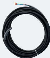
Cavo rettilineo fino a 30m