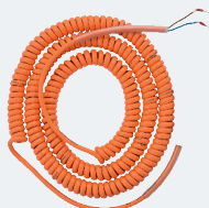
Cavo Spiraleto fino a 15 m