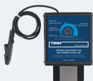
Accessori per Test