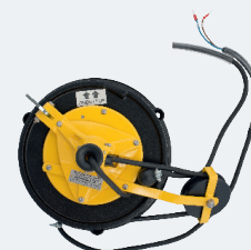
Arrotolatore per cavo fino a 10m